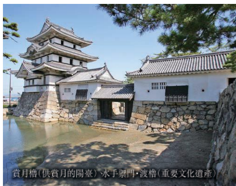
賞月櫓(供賞月的陽臺)・水手櫓門・渡櫓(重要文化遺產)

栗林公園以紫雲山為背景,是面積最大的國家文化遺產庭園。是歷經了100年以上高松、松平歷代藩主建造而成,園中有6個池塘和13座假山巧妙佈局而成,園景富於變化有“一步一景”的美稱;在南湖,可依藩主的心情盡情遊船。