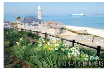
男木島水仙和燈塔