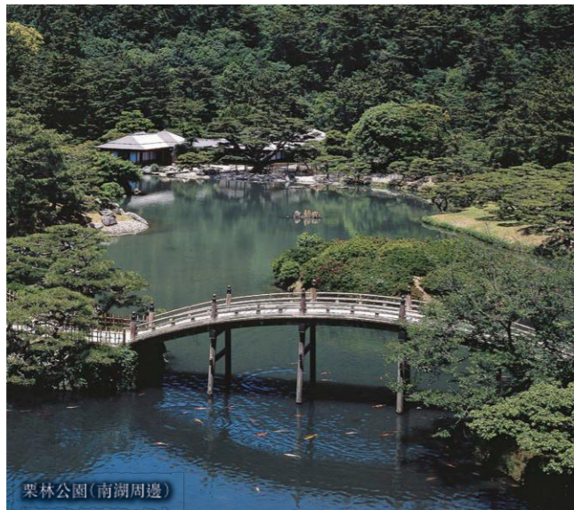
栗林公園(南湖周邊)