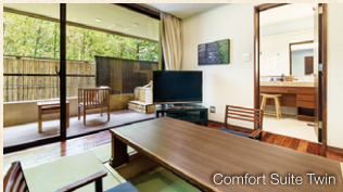
Comfort Suite Twin