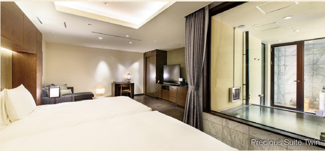
Precious Suite Twin