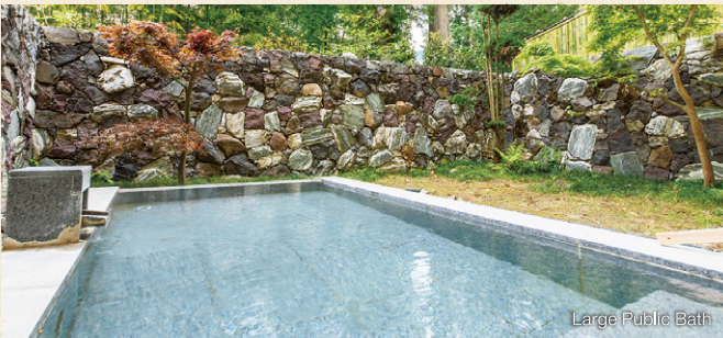
Large Public Bath

preferred style of accommodation. The baths are simple low-alkali hot-spring baths whose waters will soothe your skin. There's also a large public bath with a dry sauna available. Relax both body and mind while taking a leisurely soak in charming surroundings.