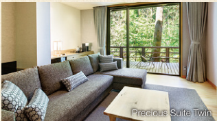
Precious Suite Twin