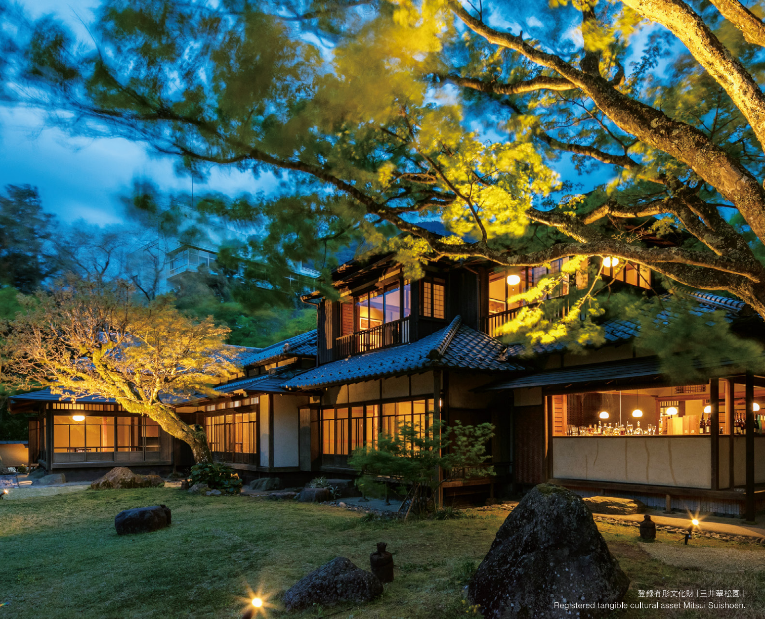
登録有形文化財「三井翠松園」 Registered tangible cultural asset Mitsui Suishoen.

四季の彩り 豊富な温泉 歴史が交わる箱根 小涌谷 かつてこの地に三井財閥の別荘として建てられた、 登録有形文化財「三井翠松園」は、 「箱根・翠松園」の料亭としてその歴史を今に紡ぐ。 山の静寂と鮮やかな木々花々の息吹きが身を包み、 心を癒すひとときをお過ごしいただけます。