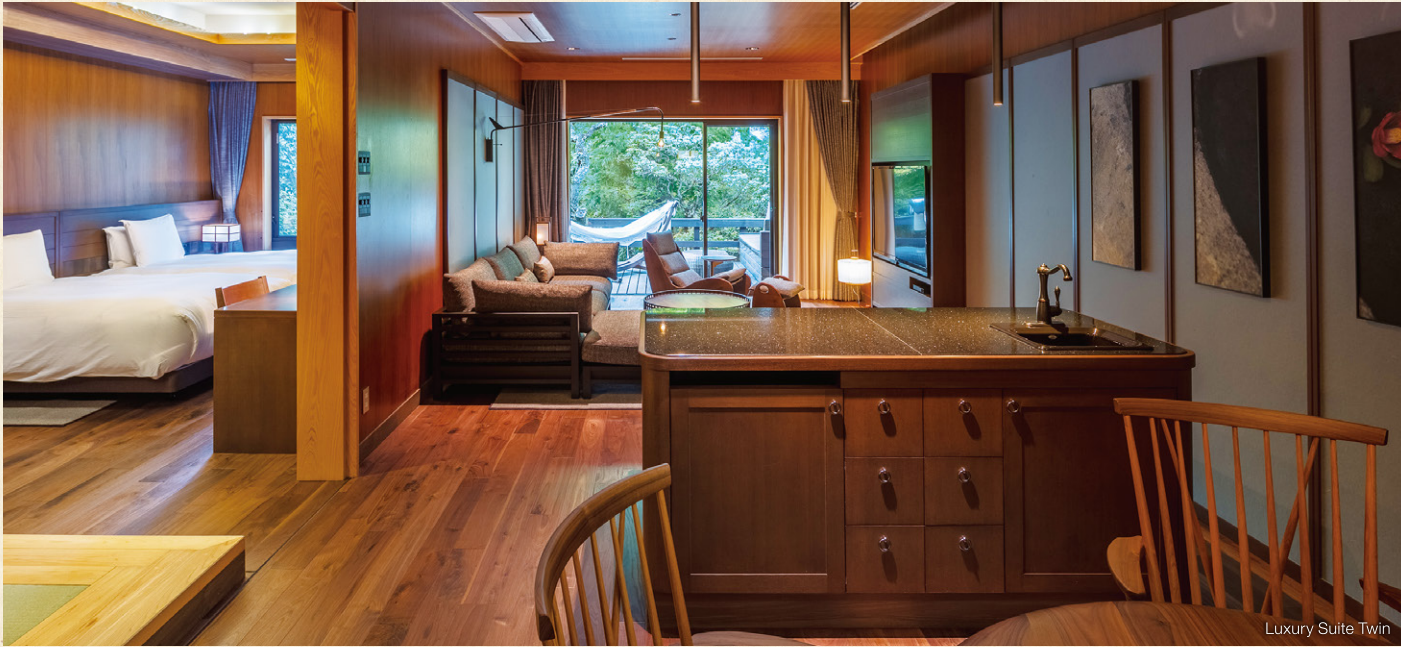
Luxury Suite Twin