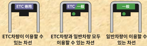
ETC차량이 이용할 수 있는 차선 ETC차량과 일반차량 모두 이용할 수 있는 차선 일반차량이 이용할 수 있는 차선