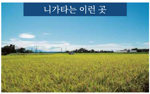
아름다운 자연과 전원 풍경, 다양한 문화가 어우러진 니가타현

혼슈의 거의 중앙에 위치하며 바다에 접해 있습니다. 광활한 토지와 바다, 산, 강 등 풍부한 자연의 혜택으로 쌀농사와 술 제조가 성행하고 있습니다. 남북으로 길게 조에쓰, 주에쓰, 가에쓰, 사도의 4개 지역으로 구분되어 지역마다 특색 있는 전통과 문화가 존재하고, 사계절 풍경이 뚜렷하여 1년 내내 계절별 매력을 만끽할 수 있습니다.