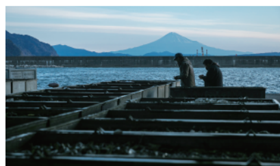
飽覽山海美景 富士山 & 駿河灣