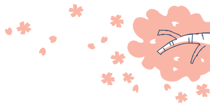
SL蒸氣火車眺望公園 島田市