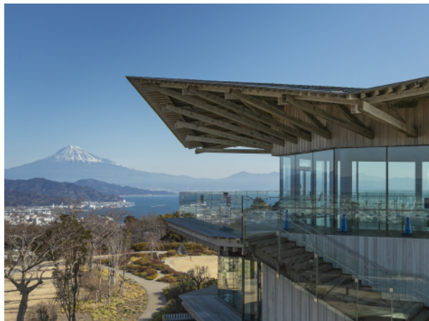
從日本平 飽覽富士山海美景