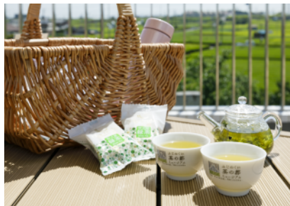
富士之國茶之都博物館 島田市