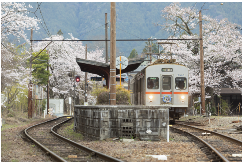
川根本町 大井川鐵道 駿河徳山站