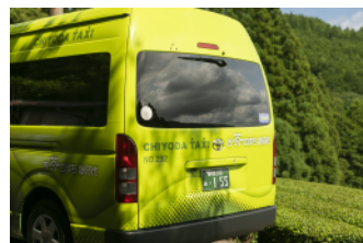
靜岡市 綠茶計程車