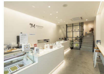
MARUZEN TEA ROASTERY 静岡市