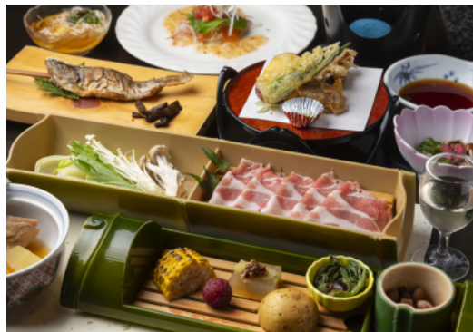
寸又峽温泉 翠紅苑 川根本町