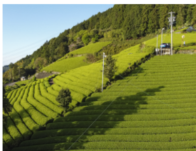
駿河的 富士山 & 茶園 & 豐海

位在靜岡縣中部的「駿河」地區，是一處匯聚風景名勝、茶文化、好山好水、自然風光、友善人情的日本第一茶鄉，綿延無際的茶園風光延伸至駿河灣，相連到日本第一聖山—富士山，造就「駿河」獨一無二的茶園風情。