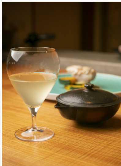
Bar No'Age 靜岡市