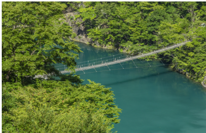
寸又峽夢之吊橋 川根本町