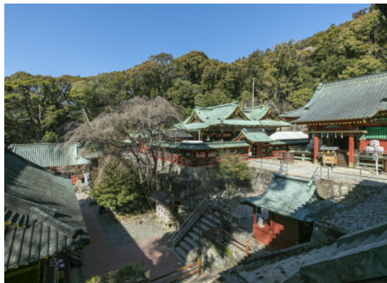
久能山東照宮 靜岡市