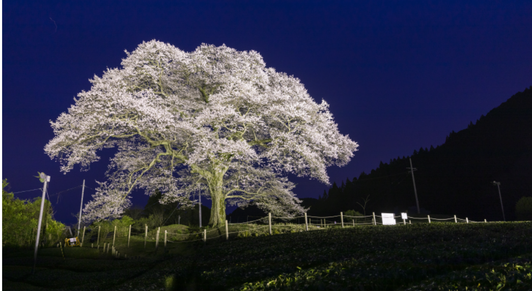
牛代水目櫻 島田市