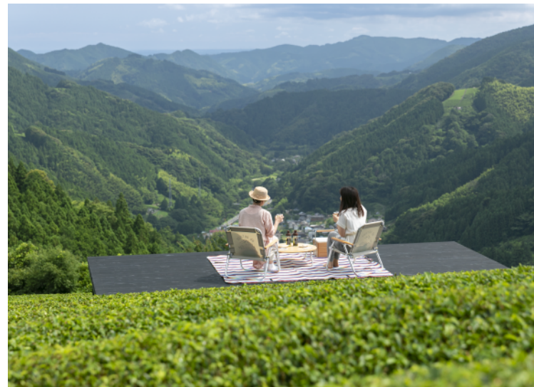
市之瀬之里 藤枝市