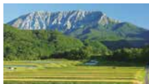
Parc national de Daisen-Oki