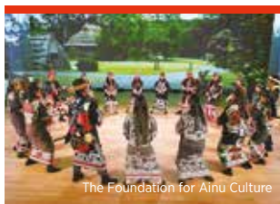
The Foundation for Ainu Culture

Véritable écrin pour les espèces des climats polaires, ce zoo en abrite une centaine, dans des conditions proches de leurs habitats naturels. Ne manquez pas la promenade quotidienne des pingouins et le bassin de jeux des ours polaires !