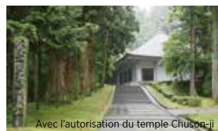
Temple Chuson-ji (Hiraizumi), Konjikiido (Pavillon d'or)

■ = Patrimoine mondial culturel ■ = Patrimoine mondial naturel