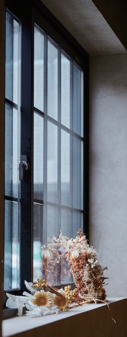
ROUGH cafe dinning bar