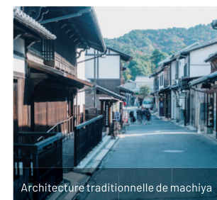
Architecture traditionnelle de machiya