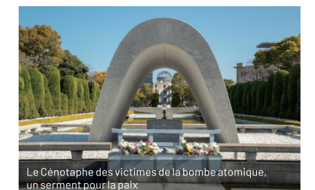
Le Cénotaphe des victimes de la bombe atomique, un serment pour la paix