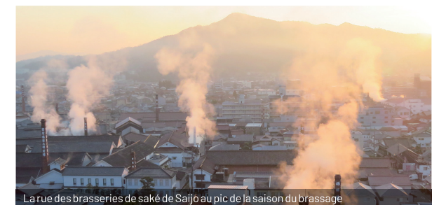
La rue des brasseries de saké de Saijo au pic de la saison du brassage

* Miho Imada, la maître brasseuse de la brasserie de saké Imada-Shuzo est la seule japonaise sélectionnée en 2020 pour l'émission de la BBC « 100 Women ».