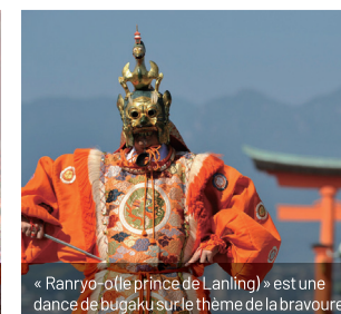
« Ranryo » (le prince de Lanling) est une danse de bugaku sur le thème de la bravoure