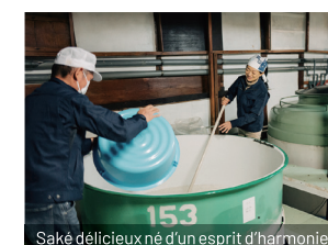
Saké délicieux né d'un esprit d'harmonie