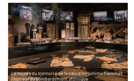
Le musée du mémorial de la paix d'Hiroshima transmet l'horreur du bombardement atomique