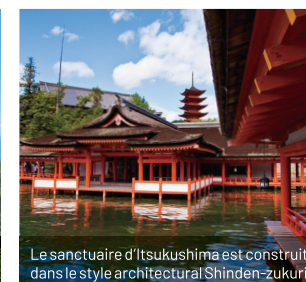
Le sanctuaire d'Itsukushima est construit dans le style architectural Shinden-zukuri