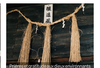
Prières et gratitude aux dieux environnants