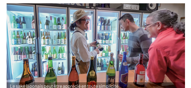
Le saké japonais peut être apprécié en toute simplicité