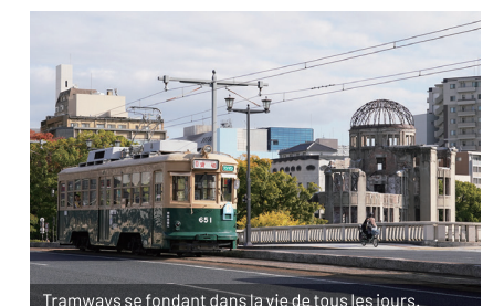
Tramways se fondant dans la vie de tous les jours.