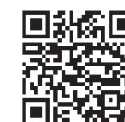
Brochure de voyage (anglais)