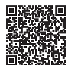
Présentation vidéo du charme d'Hiroshima!