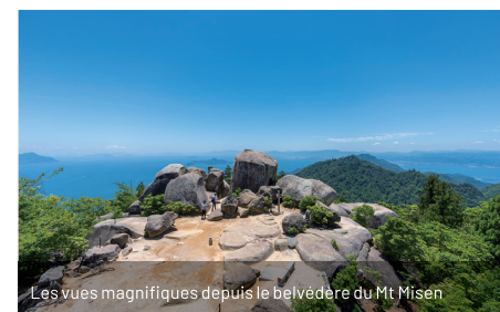
Les vues magnifiques depuis le belvédère du Mt Misen

Le paysage formé par les alignements de résidences et de maisons traditionnelles machiya est magnifique et témoigne du passé de ce bourg construit autour d'un temple.