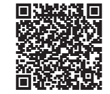
用视频 介绍广岛县的魅力!