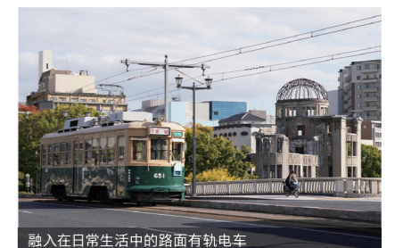
融入在日常生活的路面有轨电车