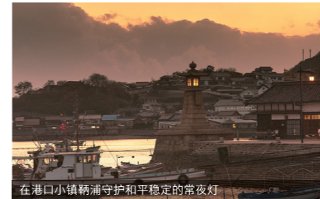
在港口小镇鞆守护和平稳定的常夜灯

散布在濑户内海上的岛屿编织出了一幅壮丽的美景。在此，您可以委身于风平浪静的大海，享受治愈的奢侈时光。而在海的那一边，在大自然的丰厚馈赠中，人们世代代在那里生活着。可在绝美景色中横跨海峡的“岛波海道”等魅力十足的骑行道路、SUP和海上皮划艇、钓鱼等各种活动为人提供无限的乐趣，到处都能让人感受到野外的精彩和自然的美好。