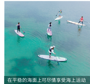
在平稳的海面上可尽情享受海上运动