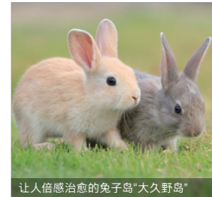
让人倍感治愈的兔子岛“大久野岛”