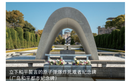
立下和平誓言的原子弹爆炸死难者纪念碑 (广岛和平都市纪念碑)

原爆圆顶屋是全人类的和平纪念碑，传达着世界和平的重要性。1945年8月6日上午8点15分，整个城市在一瞬间失去了往日的光景。但是，人们活下去的愿望和爱乡之情托起了这片曾被认为是“75年间将寸草不生”的土地。在原子弹被投下仅3天后，有轨电车又重新行驶在路面上，为城市重建倾注的努力获得成效，挽回了广岛街道的命脉。对于广岛来说，这片深知和平之宝贵的祈愿圣地时刻融入在日常生活之中。