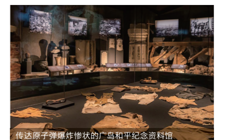
传达原子弹爆炸惨状的广岛和平纪念资料馆