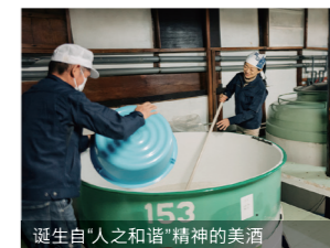
诞生自“人之和谐”精神的美酒