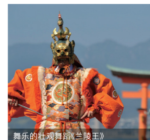
舞乐的壮观舞蹈《芒陵王》