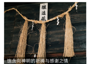
饱含向神明的祈祷与感谢之情