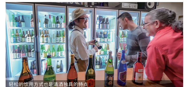
轻松的饮用方式也是清酒独具的特点