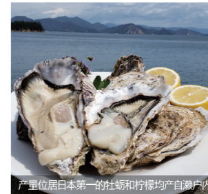
产量位居日本第一的牡蛎和柠檬均产自濑户内