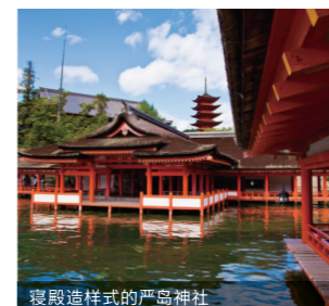
寝殿造样式的严岛神社