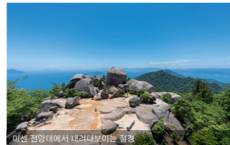
미센 전망대에서 내려다보이는 절경

1400년 이상의 역사를 가진 미야지마 섬의 이쓰쿠시마 신사. 예로부터 섬 전체가 신으로 숭배되어 왔으며, 멀리서 보면 관음보살이 자는 모습처럼 보이는 능선이 바다다보입니다. 바다 위에 세워진 신전과 오토리이는 바닷물이 빠지는 정도에 따라 다양한 모습을 보여주며, 간조 시에는 오토리이 아래를 걸어도닐 수도 있습니다. 엄숙한 분위기 속에서 신에게 봉납하는 무악과 노는 지금도 제례 의식 때 볼 수 있습니다. 몬젠마치로 번성했던 옛날을 떠오르게 하는 주택과 전통 상가들이 늘어서 있는 풍경도 매력적입니다.