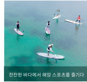
잔잔한 바다에서 해양 스포츠를 즐긴다