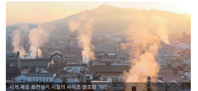
사케 제조 최전성기 시절의 사이조 양조장 거리

※이마다 주조의 사케 장인 이마다 미호는 2020년에 'BBC 100 Women'으로 선정된 유일한 일본인입니다.