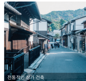
전통적인 상가 건축