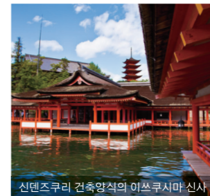
신덴즈쿠리 건축양식의 이쓰쿠시마 신사