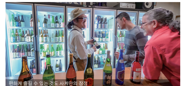
편하게 즐길 수 있는 것도 사케만의 장점