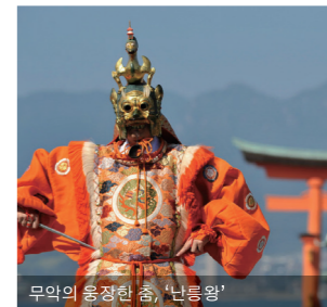
무악의 웅장한 춤, '난류왕'