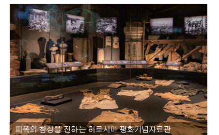
피폭의 참상을 전하는 히로시마 평화기념자료관