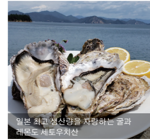
일본 최고 생산량을 자랑하는 굴과 레몬도 세토우치산