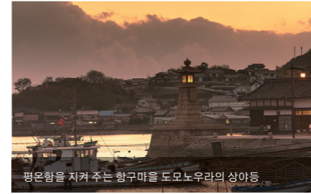
평온함을 지켜 주는 항구마을 도모노우라의 상아등

세토내해에 흠어진 섬들이 이루는 장대한 아름다움. 잔잔한 바다에 몸을 맡기며 힐링하는 호화로운 시간. 저편에는 일하는 사람들과 자연이 선사하는 혜택이 가득한 일상이 계속되고 있습니다. 절경과 함께 해협을 횡단할 수 있는 '시마나미海道'를 비롯한 매력적인 사이클링 로드, SUP나 카약, 낚시 등 액티비티의 즐거움으로 가득한 필드의 훌륭함, 사랑스러운 자연을 느낄 수 있는 환경이 펼쳐집니다.