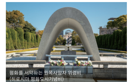
평화를 서약하는 원폭사망자 위령비 (히로시마 평화도시기념비)

세계 평화의 중요성을 호소하는 인류 공통의 평화기념비와 원폭돔. 1945년 8월 6일 오전 8시 15분, 그때 거리는 한 순간에 평범한 일상을 잃고 말았습니다. '75년간은 풀도 나무도 자라지 않을 것'이라 여겨지던 이 땅을 지켜온 것은 사람들의 살고자 하는 바람과 향토에 대한 사랑. 원폭 투하 후 불과 3일 만에 노면 전차가 달리고 복구를 위한 부단한 노력이 결실을 맺어 히로시마의 거리는 생명을 되찾았습니다. 평화의 소중함을 기억하는 기원의 성지는 히로시마에서 평소의 삶 속에 언제나 녹아 있습니다.