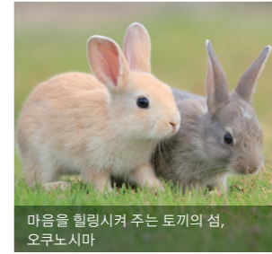
마음을 힐링시켜 주는 토끼의 섬, 오후노시마