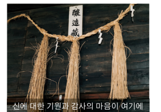
신에 대한 기원과 감사의 마음이 여기에