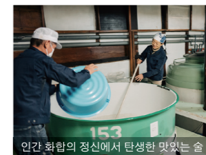
인간 화합의 정신에서 탄생한 맛있는 술