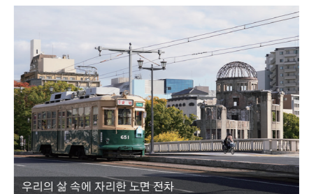
우리의 삶 속에 자리한 노면 전차