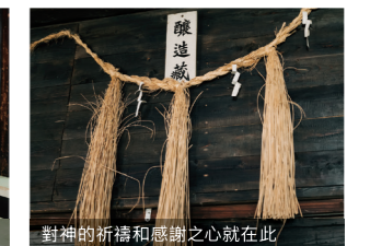
對神的祈禱和感謝之心就在此