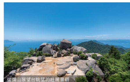
從彌山展望台眺望的壯麗景觀

擁有1400年以上歷史的宮島嚴島神社，自古整座島嶼皆被奉為御神體，受到人們的敬仰，遠處可眺望到酷似觀世音睡姿的山脊線。建於海上的神殿和大鳥居，其風貌會隨著潮汐漲落而變化，退潮時還可以從大鳥居下穿過。祭神的舞樂和能樂，氣氛莊嚴隆重，現在仍在祭典儀式中演出。於神社周邊形成、繁榮的城鎮，昔日懷舊宅邸和傳統街屋鱗次櫛比，景觀極具魅力。