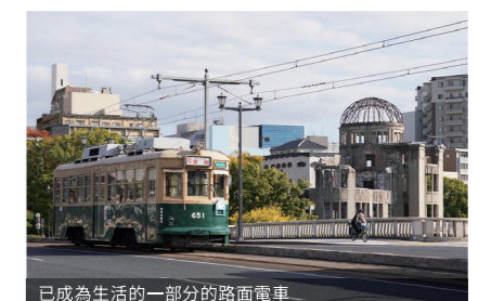
已成為生活的一部分的路面電車