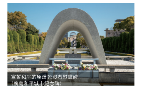
宣誓和平的原爆死沒者慰靈碑 (廣島和平城市紀念碑)

原爆圓頂館是人類共同的紀念碑，提醒我們世界和平的重要性。1945年8月6日上午8點15分，廣島的日常瞬間遭受摧毀。這片曾經被訴為「75年不會長出一草一木」的土地，因著人們對生存的渴望與對鄉土的熱愛，在原子彈投下的僅僅3天後，路面電車便開始行駛，且經過努力不懈地重建，讓廣島這座城市重新恢復生機。對廣島而言，這個認識和平重要性的祈禱聖地一直是人們生活的一部分。