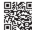
旅遊宣傳小冊子(英文)