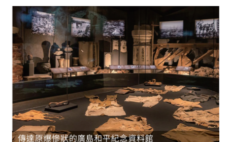
傳達原爆慘狀的廣島和平紀念資料館